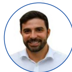
Igor Normando Prefeito de Belém/PA