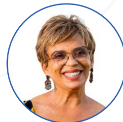
Marília Campos Prefeita de Contagem/MG