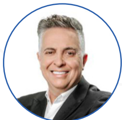
Álvaro Damião Prefeito de Belo Horizonte/MG