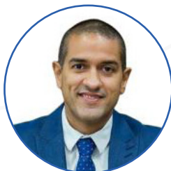
Arthur Henrique Prefeito de Boa Vista/RR