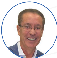
Airton Souza Prefeito de Canoas/RS