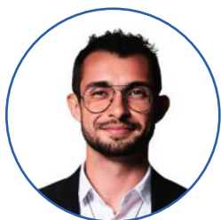
Carlos Du Prefeito de Barbacena/MG