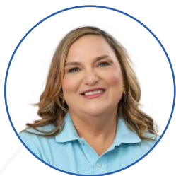
Francineti Carvalho Prefeita de Abaetetuba/PA