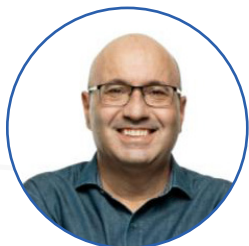
Dário Saad Prefeito de Campinas/SP